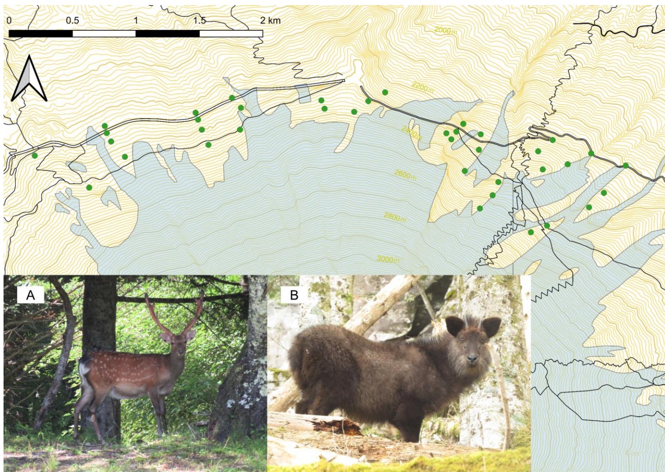
図1：富士山森林限界周辺のカメラ設置地点（緑点）とニホンジカ（A）とニホンカモシカ（B）。黒線は登山道、水色は高山帯を意味する。