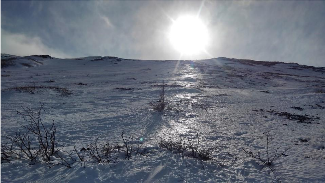
図3：厳冬期の富士山森林限界の景観（2020年1月撮影）。気温 -18^{\circ}\text{C} 、平均風速20m、林縁の植物のほとんどが氷雪の下に埋まる。シカは厳しい環境条件を避けて季節移動をおこなうが、カモシカは森林限界の厳しい冬を生き抜く。