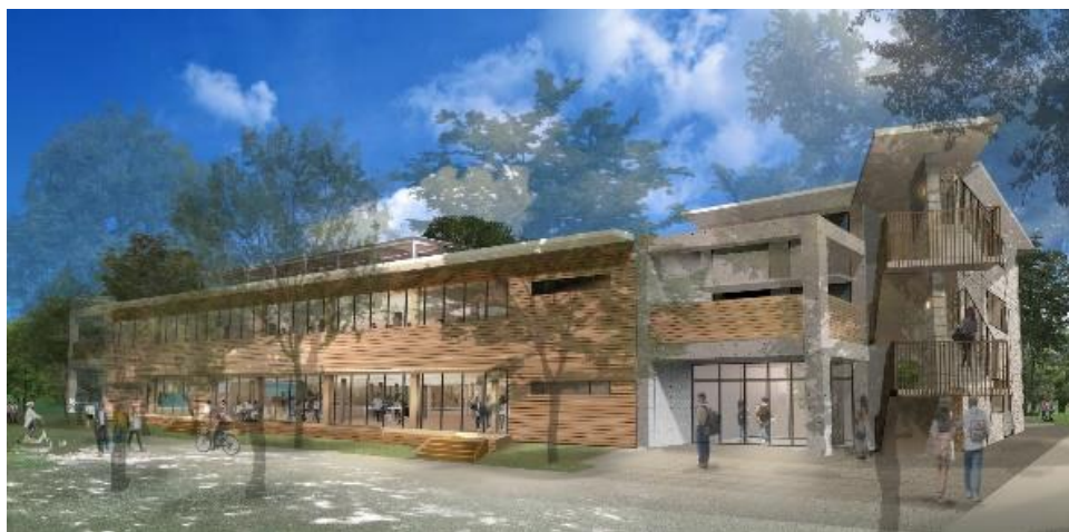
本拠点完成予想図

本拠点は、東京多摩（西東京）地域が国際的に注目されるよう、この地域にある知的価値を集め、グローバルな産業へと展開する拠点となることを目指しています。「農」と「食」、そして「エネルギー」に焦点を当て、西東京地域の皆様と新しい未来を共創する拠点にしていきます。